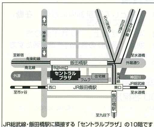
JR総武線・飯田橋駅に隣接する「セントラルプラザ」の10階です