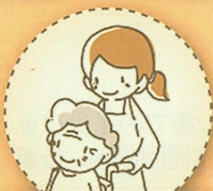
病院ボランティア