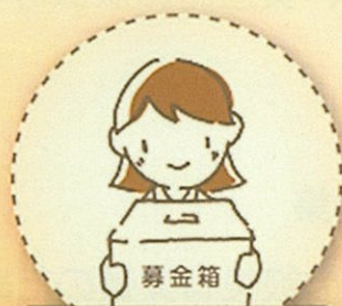
義援金・救援金募集