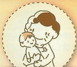
子どもの健全育成