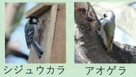
シジュウカラ アオゲラ