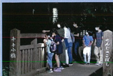
ホタルを觀賞（千手小橋）