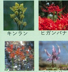
キンラン ヒガンバナ キツネノカミソリ カタクリ