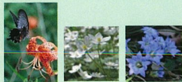
オニユリ ニリンソウ フェリンドウ