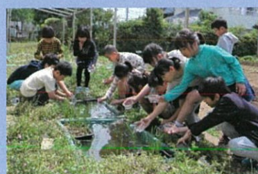
子どもたちが池を作り、ヘイケボタルの幼虫を放流（立川市立六小）