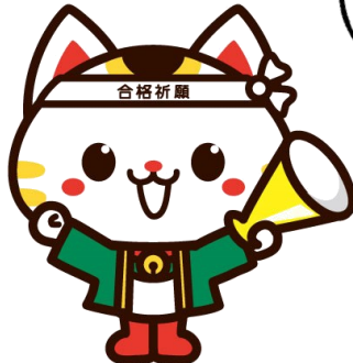
受験生応援キャラクター チャレニャン